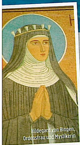
Hildegard von Bingen, Ordensfrau und Mystikerin

Wer nachts nicht zur Ruhe kommt, sollte es vielleicht mal mit einem Traumfänger probieren. Nach indianischer Überlieferung vertreibt er böse Gedanken und sorgt für entspannten Schlaf. (ca. 15 Euro, über www.conleys.de )